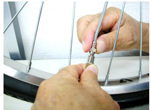
⑥ ニップルナット (長) をしめる 注：バルブアダプタが回らないように 軽く抑えながらニップルナットをねじ込む