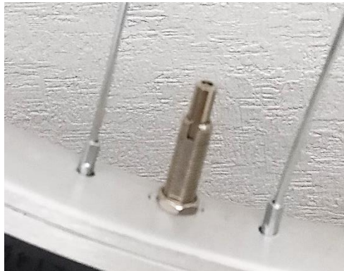
② プランジャーが入った状態