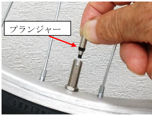
① プランジャーのついたコアをステムに差し込む

エアハブにはプランジャーを使用してください。その他のスーパーバルブ等は絶対使用しないでください。