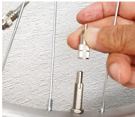
③ 英式アダプタをステムにねじ込む 注：きつくねじ込み過ぎない事 虫ゴムが切れる恐れがあります