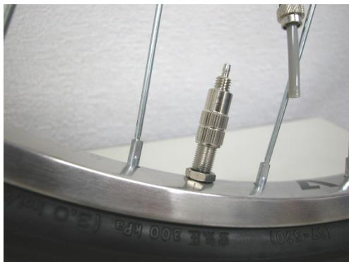
④ 英式アダプタが入った状態